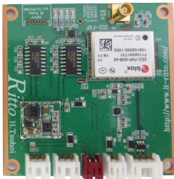
Multi GNSS Receiver