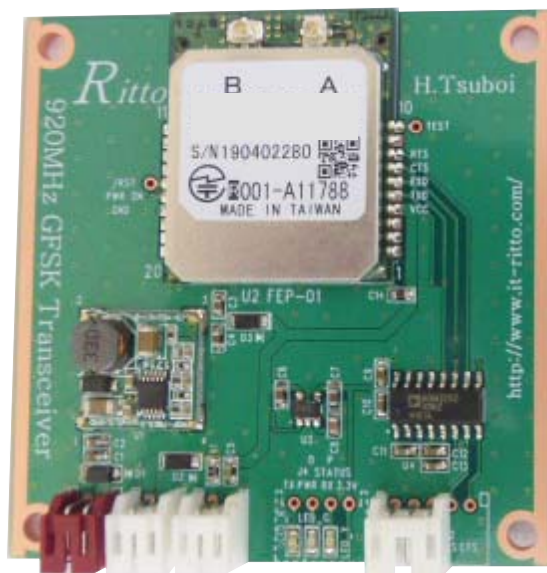
920MHz Wireless Radio