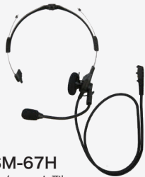
SSM-67H インターコム型 ヘッドセット