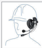
SSM-61H 工事ヘルメット用 ヘッドセット

*SSM-61H/SSM-62H/ SSM-50H使用時に接続して 本体に装着します。 *通話ボタン、CUEボタン装備