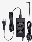
SAD-50A 連結型充電器用 ACアダプタ