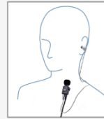
SSM-50H タイピンマイク &イヤホン