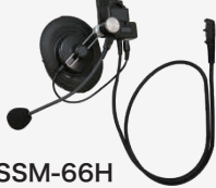
SSM-66H 工事ヘルメット用 ヘッドセット

※親機など、常時同時通話で運用する場合に便利です。(通話ボタン/CUEボタンはありません)