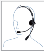
SSM-62H インターコム型 ヘッドセット