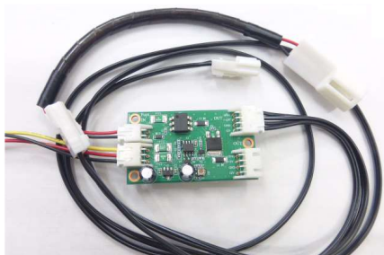
調光ユニット&ケーブルセット

LEXUS IS用フットランプ常時点灯キットは既存ケーブルに付属のケーブルASSYと減光ユニットを接続する事でドライブ時に減光した状態で常時点灯し、通常はG-カスタマイズで設定された点灯時間で消灯します。減光ユニットにはBAT(常時電源)、ACC(アクセサリ電源)、GND(アース)が必用でBATは既存フットランプからの接続が可能となっています。電源取出しが苦手な方は市販シガープラグを接続でも動作が可能です。