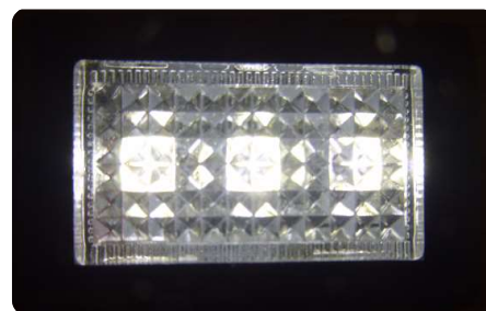
オプション増設リアフットランプ